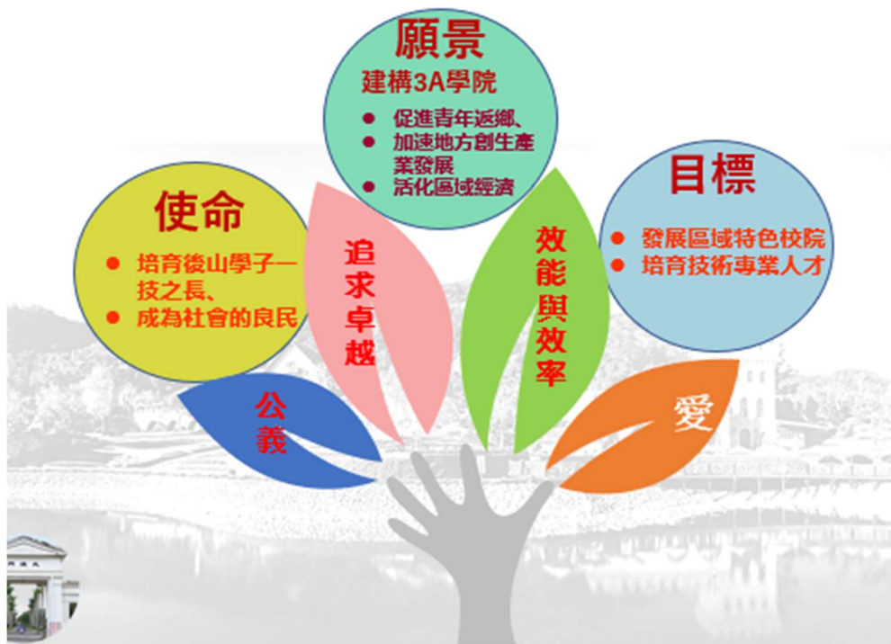
圖 1-1 辦學的使命、目標、辦學理念與願景